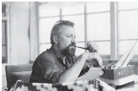
Борис Грушин {12}

Вообще говоря, задача сравнительного изучения была мною осознана в начале 2000-х и обозначена в книге с подзаголовком «От Гэллага до Грушина» [см.: 62]. Так получилось, что в последующие годы большее внимание было сосредоточено на анализе американской истории опросов и их современной практики, однако и исследование, касающееся отечественной реальности, не оставалось в стороне. К настоящему времени собраны, проанализированы