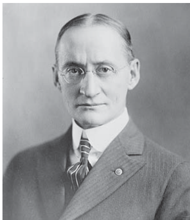
Уолтер Скотт {2}

ряд общих положений психологии применительно к производству рекламы и привнес идею о необходимости изучения рекламы в сознание ее разработчиков, а также производителей товаров и услуг.