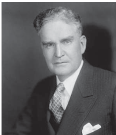
Брюс Бартон {4}

Второй гуру рекламного мира, о котором здесь следует сказать, это — Брюс Бартон (Bruce Barton, 1886–1967); он создал одно из крупнейших в стране, мире рекламных агентств, был сенатором и даже рассматривался в качестве возможного кандидата в президенты.