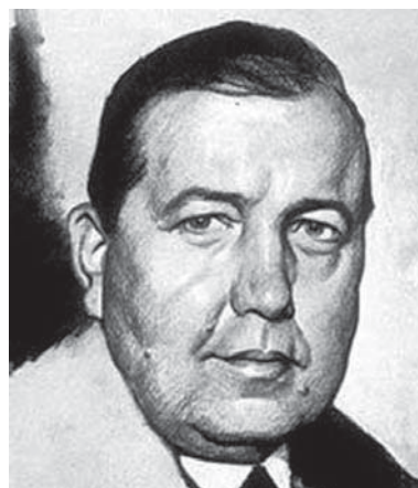
Эмиль Хурья {7}

дипломата, успешного журналиста и первого официального консультанта президента США по ведению избирательных кампаний [см.: 38]. Основные научные достижения Хурья связаны с прогнозированием итогов общенациональных выборов. Он начал свои разработки в конце 1920-х, и его высшие достижения пришлось на первую половину 1930-х годов. Когда имена Гэллага и других основоположников современной технологии измерения общественного мнения еще никому ничего не говорили, журналисты ведущих американских газет, оценивая шансы претендентов на победу в президентских выборах, начинали свои сообщения словами: «как сказал Эмиль Хурья».