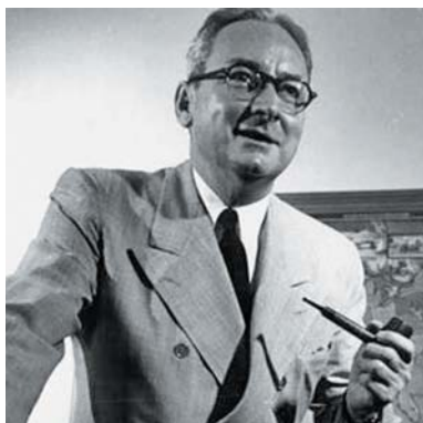
Элмо Роупер {10}

Статьи в энциклопедиях, опубликованные в 1940-х — 1960-х годах, представляют Элмо Роупера (Elmo Roper, 1900–1971) прежде всего как исследователя рынка и уже затем как аналитика общественного мнения. В этом, несомненно, есть значительная доля правды. Вместе с тем, Роупер — аналитик общественного мнения, отличающийся высоким профессионализмом и гражданской активностью. В период Второй мировой войны, во многом благодаря ему, Франклин Рузвельт, политическая элита США осознали прагматическую ценность опросов обще-