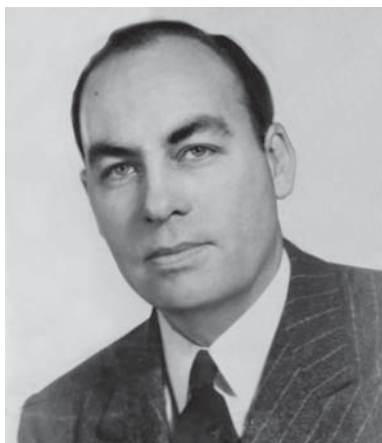
Джордж Гэллп {9}

Вообще говоря, рассказ о жизни и творчестве Гэллпа уже начался: приводились некоторые факты из истории его семьи и указывалась роль идей Брайса в становлении гэллаповской философии изучения общественного мнения. Теперь рассмотрим цепочку жизненных событий, предшествовавших его исследованиям общественного мнения.